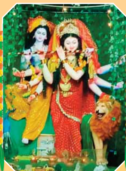
युवा दुर्गा उत्सव समिति रांझी जल शोधन गेट