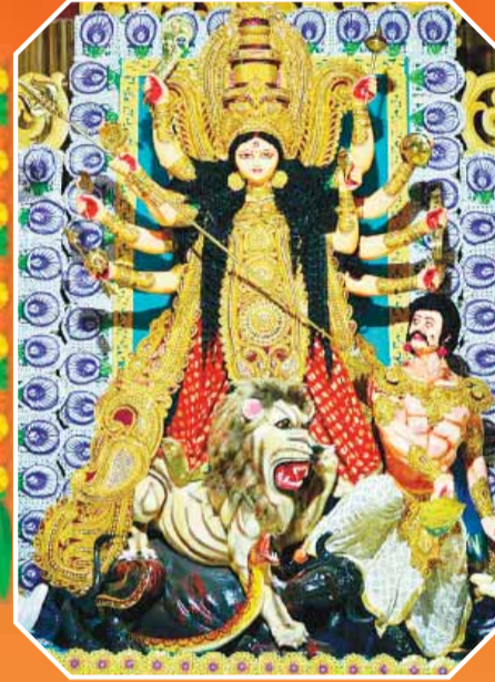
दीनदयाल चौक पर विराजी माता रानी