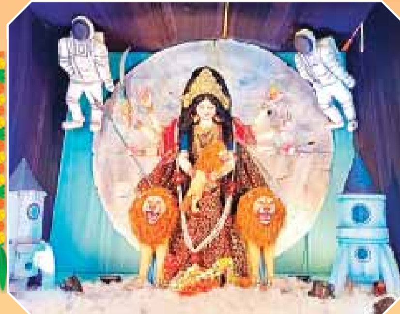
दीप कला मंदिर न्यू शोभापुर