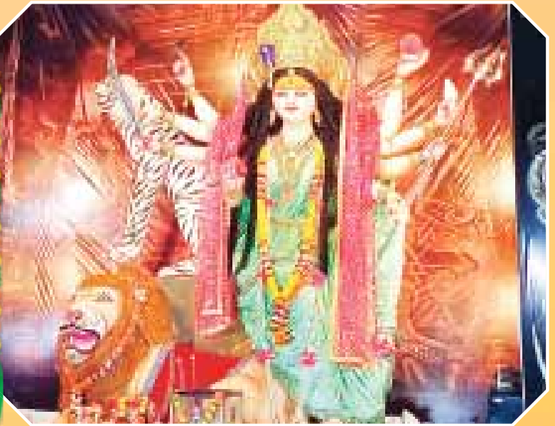
गांधी व्यायाम शाला दुर्गा उत्सव समिति रांझी