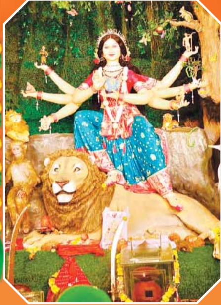
दीनदयाल क्षेत्र की माता भवानी