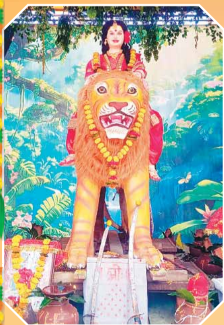
विशाल दुर्गा उत्सव समिति हाथीताल गुरुद्वारा