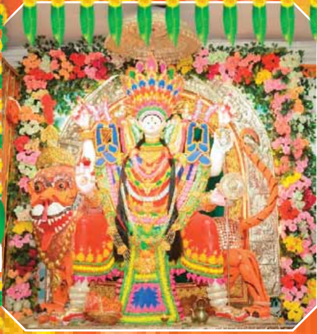
नुरहाई की दुर्गा जी