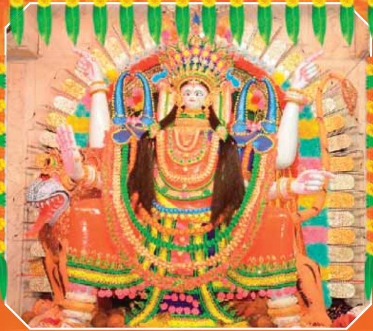
सुनरहाई की दुर्गा मां