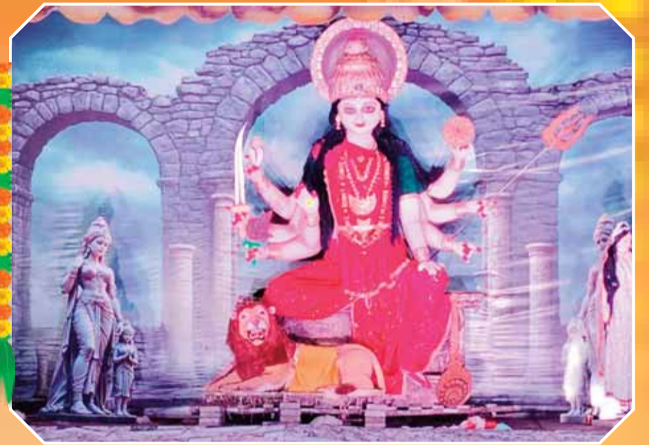
चेरीताल पारिजात बिल्डिंग के पीछे मैदान में विराजी माता रानी की भव्य प्रतिमा व झांकी