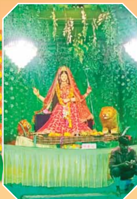
अधारताल इंडस्ट्रियल एरिया में विराजी माता की अनुपम छवि