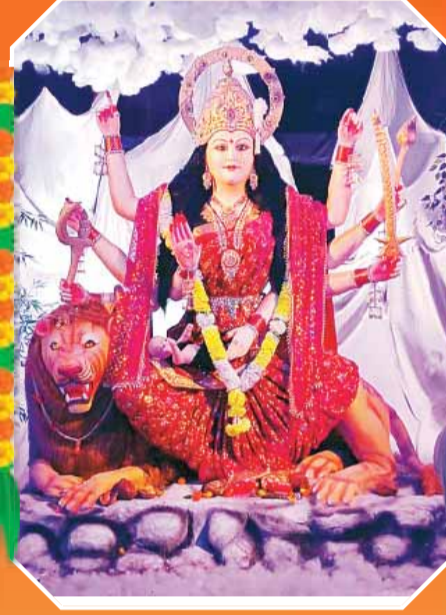
उत्साह परिवार अशोकनगर अधारताल