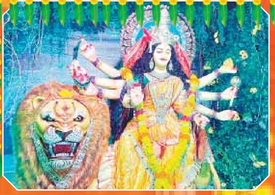
शिवधाम दुर्गाोत्सव समिति शिव पार्क कचनार सिटी में विराजी माता सिंहवाहिनी