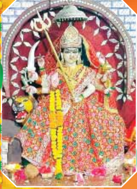
मां राजेश्वरी मां शंकर नगर सुहागी