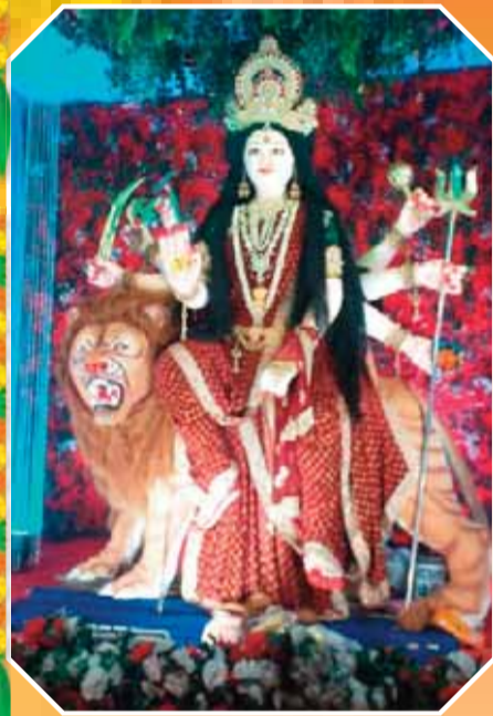
मां शारदा विजयनगर चौक की माता रानी