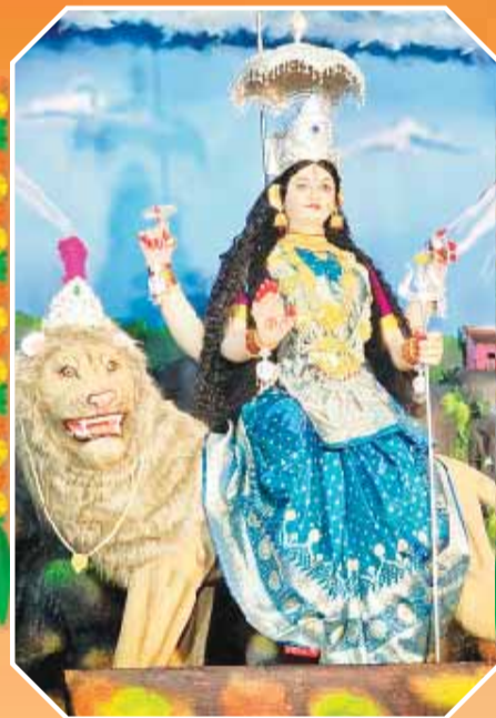
आदर्श बाल मंडल दुर्गाोत्सव समिति उपरैनगंज दीक्षितपुरा नटबाबा की गली