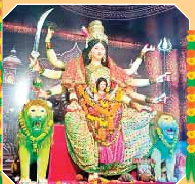
गोकलपुर की महारानी