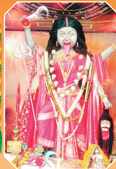
मां महाकाली परिवार समिति गुप्तेश्वर वार्ड